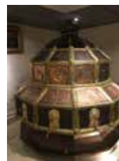
נבנה בזמן הזה על ידי משפחתנו

מִי הכיור שימשו לתחילת העבודה בנטילת יד ורגל של הכהנים, וכן להשקית האישה הסוטה. המים שבכיור נקראו מים קדושים והשאלה היא: